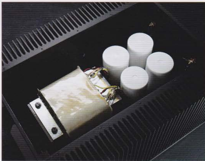
SM-101单声道后级内部结构图及背图(左下图)

重达75kg的SM-101后级扩大机采用单声道全平衡的架构来设计,而内部的线路本身就有非常高的频宽水平,令到SM-101的瞬变相当之快,在机身的内部接线均采用了Vitus Audio自家的ANDROMEDA高级线材,性能自然非同凡响。而整个机箱也是由厂方的专业技师亲自用电脑切削和手工打磨表面而精心