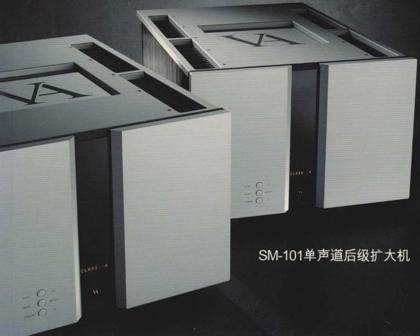
SM-101单声道后级扩大机