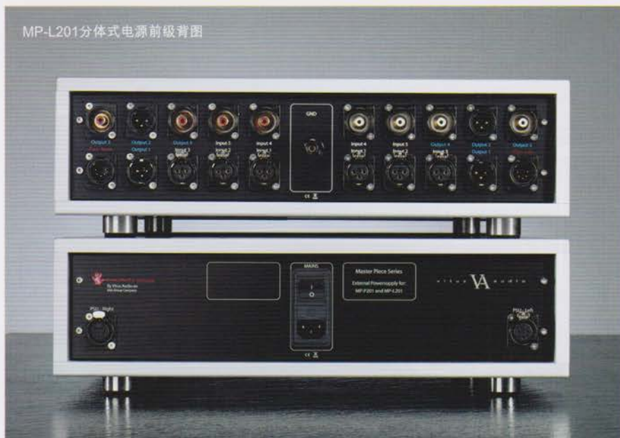
MP-L201分体式电源前级背图

在演示现场，除了得益于全套来自意大利的A.R.T.发烧线材担当幕后功臣之外，少不了就是本次的主角——丹麦Vitus Audio跟瑞典Marten的完美组合。它们包括了型号为SCD-010的CD机担当CD讯源，并采用分体式电源设计的前级扩大机MP-L201和两台SM-101单声道后级扩大机来伺候一对瑞典Marten最新的